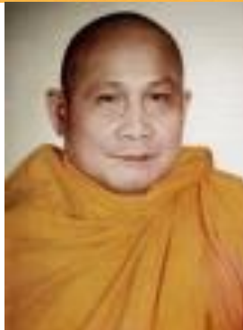
HT. Trung Quán Nguồn