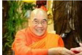
HT. Tâm Châu Dịch